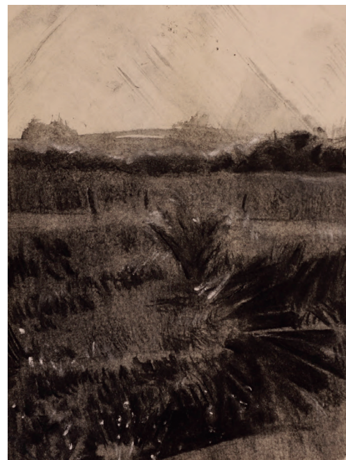
CHICO RIBEIRO Estudos para Dragão de ferro VIII, 2025 Carvão sobre papel 20cm x 15cm