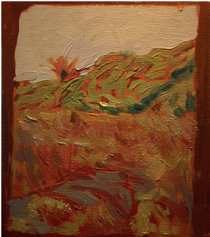
CHICO RIBEIRO Dragão de ferro #28, 2026 Óleo sobre tela 16cm x 14cm