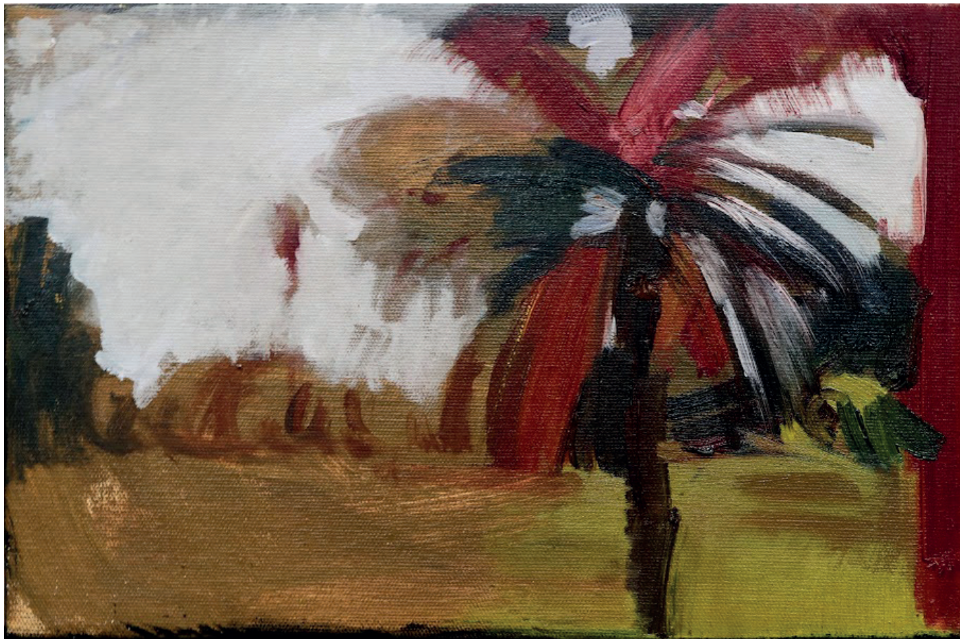
CHICO RIBEIRO Dragão de ferro #5, 2024 Óleo sobre tela 30cm x 20cm