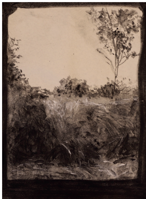
CHICO RIBEIRO Estudos para Dragão de ferro VII, 2025 Carvão sobre papel 20cm x 15cm