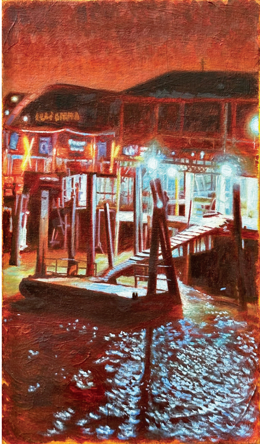
CARLA DUNCAN Atilho, 2026 Óleo e acrílica sobre tela 20cm x 30cm