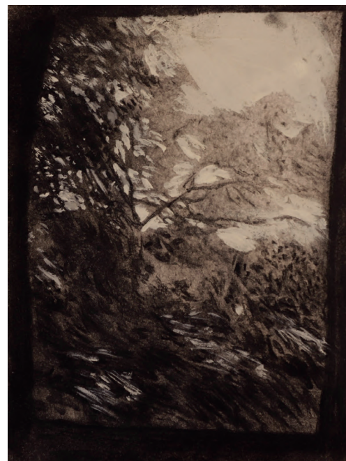
CHICO RIBEIRO Estudos para Dragão de ferro VI, 2025 Carvão sobre papel 20cm x 15cm