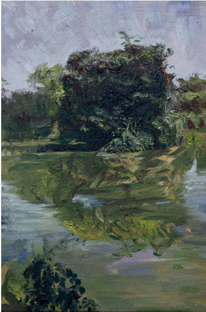
CHICO RIBEIRO No furo da água branca II, 2024 Óleo sobre tela 30cm x 20cm