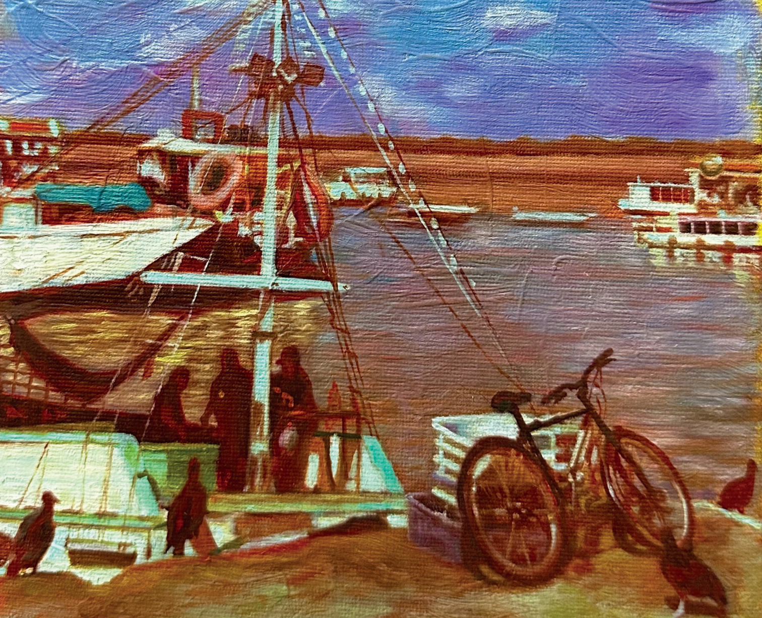
CARLA DUNCAN Panorama, 2025 (fragmento) Óleo e acrílica sobre tela 20cm x 30cm